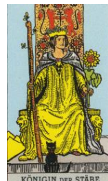
KÖNIGIN DER STÄBE