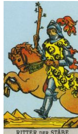
RITTER DER STÄBE