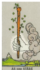
AS DER STÄBE