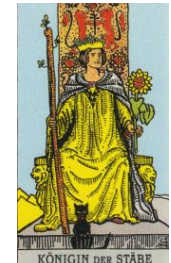
KÖNIGIN DER STÄBE