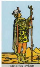
PAGE DER STÄBE