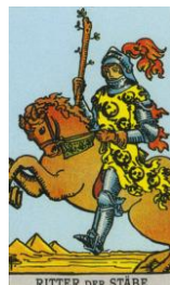
RITTER DER STÄBE