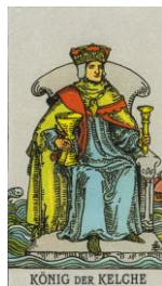
KÖNIG DER KELCHE