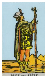
PAGE DER STÄBE