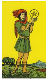
PAGE DER MÜNZEN