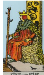
KÖNIG DER STÄBE