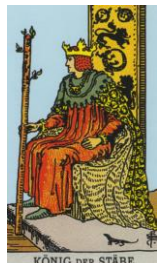
KÖNIG DER STÄBE