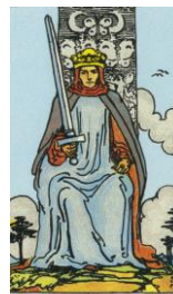
KÖNIG DER SCHWERTER