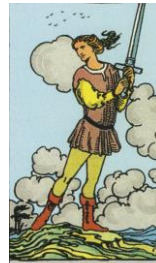
PAGE DER SCHWERTER