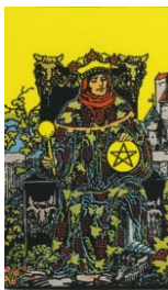
KÖNIG DER MÜNZEN